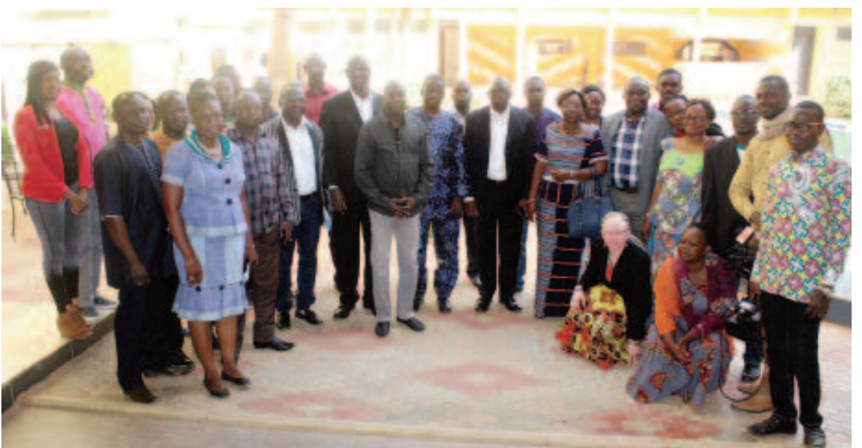
Photo de famille des séminaristes