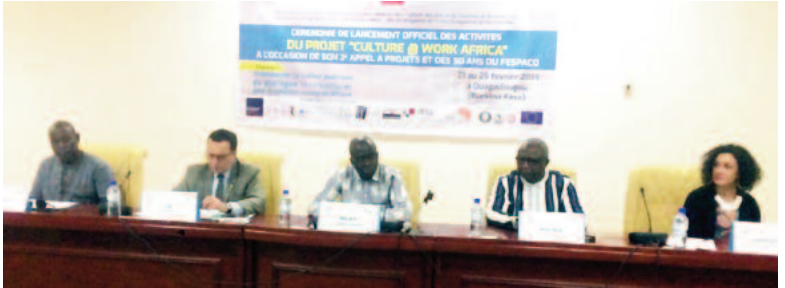
Le présidium au lancement officiel du projet "Culture at Work Africa"

sadeur, chef de la délégation de l'Union Européenne au Burkina Faso. Parrain de l'activité, il affirmera qu'à l'Union Européenne, ils partagent la vision que la culture est un facteur de cohésion sociale, de dialogue et de développement : «C'est à cet effet que l'Union Européenne soutient les politiques culturelles et aussi les porteurs de projets». «Il y a une conjonction d'énergie pendant le FESPACO pour faire de la culture vraiment un moteur de développement économique et de cohésion sociale», a-t-il poursuivi. Il a également annoncé le lancement d'un programme semblable destiné à accompagner la politique de notre pays. Le programme sera appuyer par Abdoul Karim Sango, ministre de la Culture, des Arts et du Tourisme et le directeur général de la coopération internationale et du développement de l'UE.