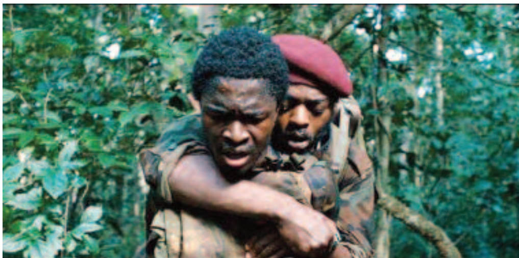
Extrait du film «The Mercy of the jungle» présentant les acteurs principaux, le sergent Xavier et le soldat Faustin