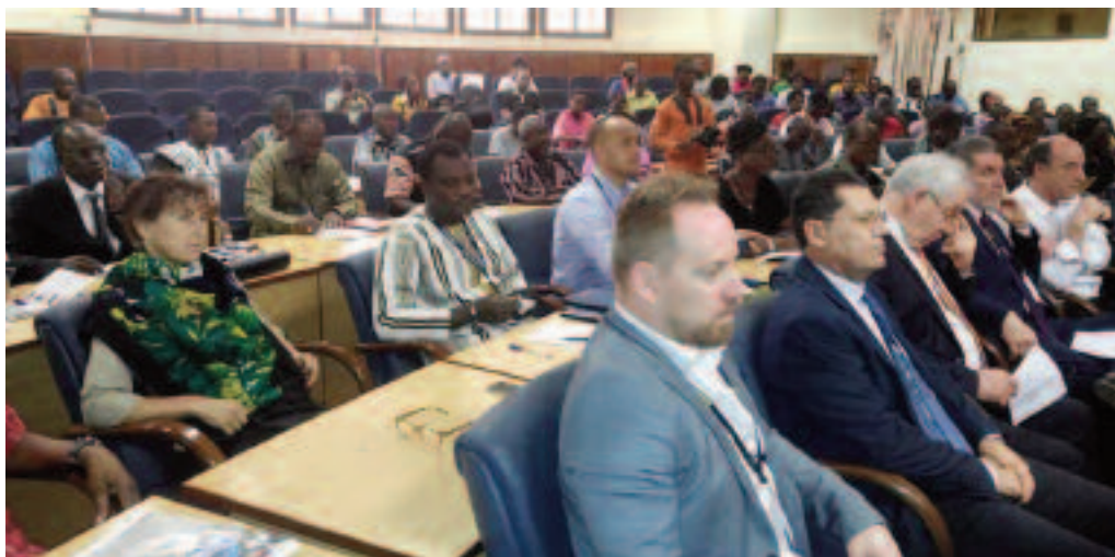
Les participants à la rencontre

Concrètement, il ressort des présentations que cette coopération a permis la tenue de sept (07) sessions de commissions mixtes permanentes (CMP) ; une constante priorisation du Burkina Faso parmi les 11 pays prioritaires de la politique de coopération de Wallonie-Bruxelles ; le maintien constant de la culture dans les secteurs d'intervention de la coopération bilatérale ; l'appui technique et financier constant aux projets culturels portés par les opérateurs culturels privés et publics des deux parties ; le renforcement du réseautage entre les opérateurs culturels.