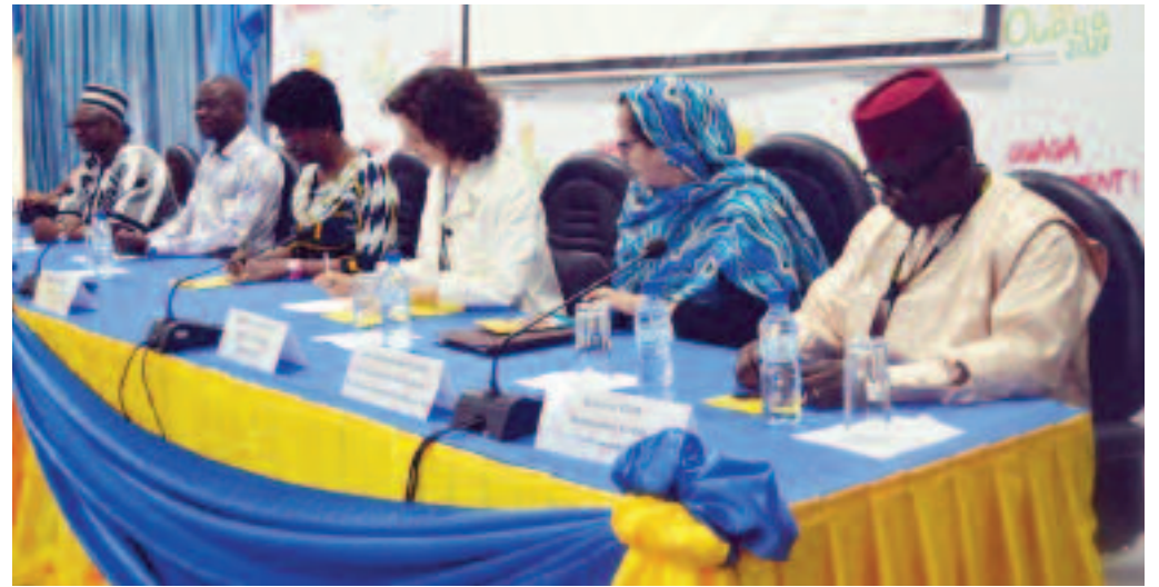
La table ronde était composée des premiers responsables de l'UNESCO et des autorités burkinabè