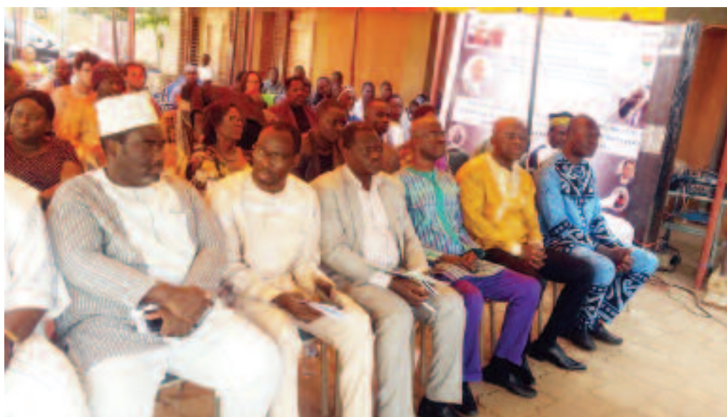
Les participants au vernissage