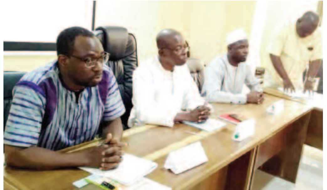
Le présidium de la cérémonie