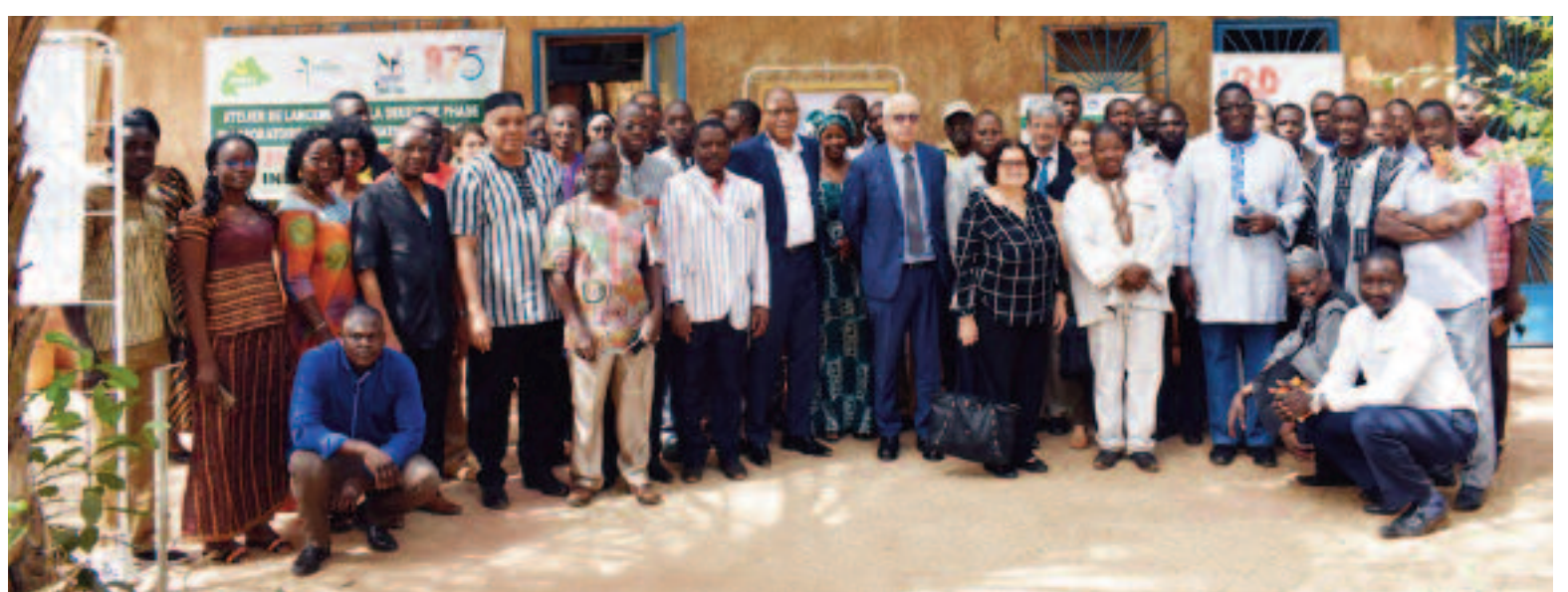
Les principaux acteurs posant à l'issue de la rencontre