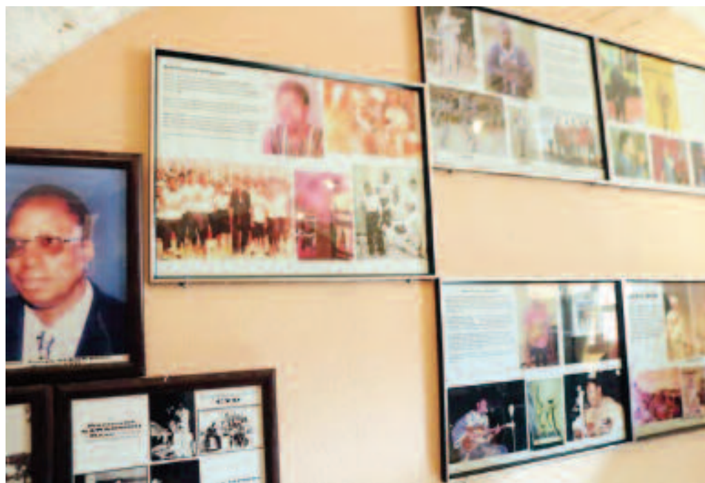
Quelques photos de l'exposition