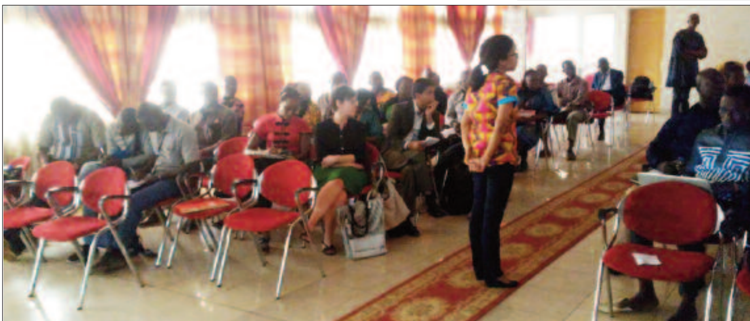
Le public a suivi avec attention la présentation du FIDC

Fonds international pour la diversité culturelle Investir dans la créativité. Transformer les sociétés.