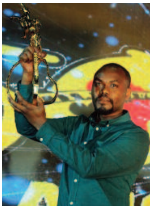
Un lauréat qui a créé la surprise