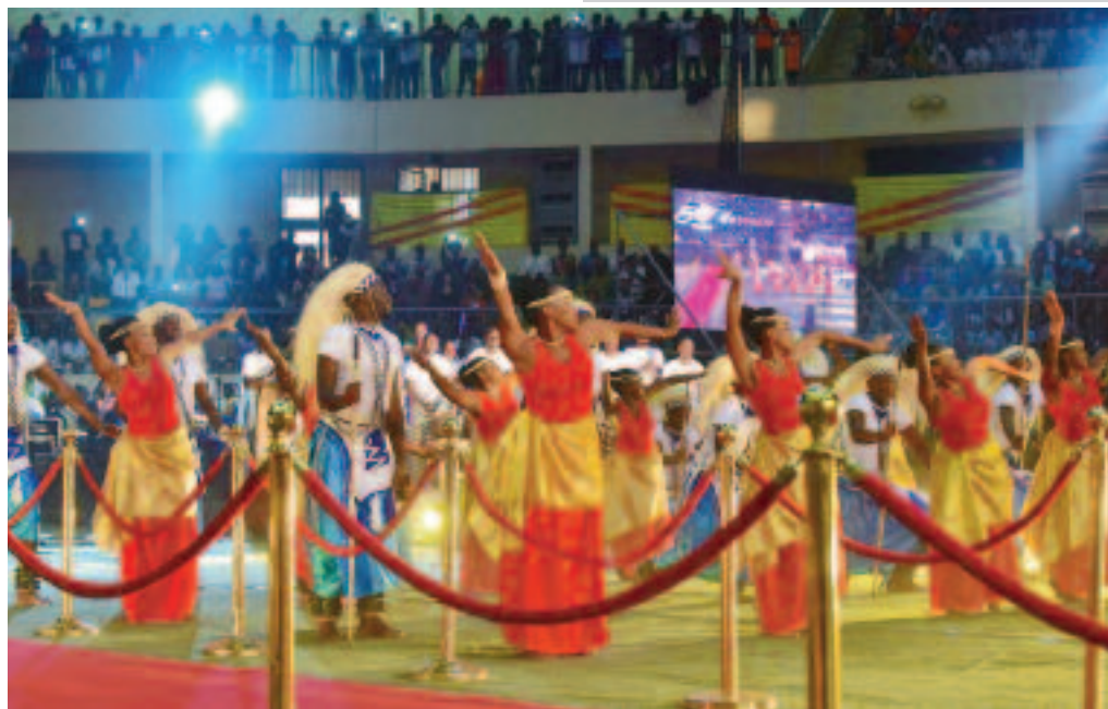
Le Ballet national du Rwanda en prestation

A cette édition, le trio de tête était composé du Rwanda, pays invité d'honneur ; de l'Égypte ( Karma de Khaled Youssef) et de la Tunisie ( Fatwa de Majmoud Ben Mahmoud). Desrances d'Apolline Traoré