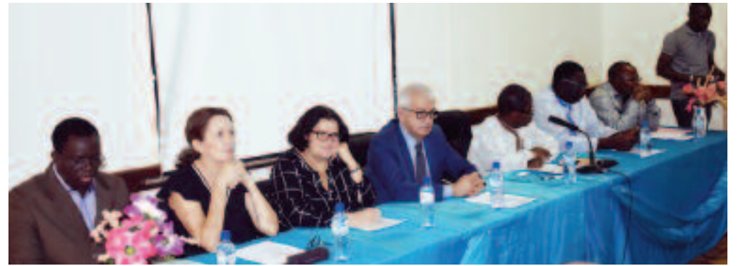
Le présidium de la cérémonie de lancement

attractives (avec des accueils issus de différents instituts de la sous-région) ; des parcelles d'étude ; des publications scientifiques dans des journaux reconnus ; des projets financés par des fondations internationales (telles que Bill et Melinda Gates ou Labex Agropolis). Initialement focalisé sur les pathogènes du riz, le LMI Patho-Bios s'est ouvert aux recherches sur différentes spéculations menacées par les bio-agresseurs, notamment les