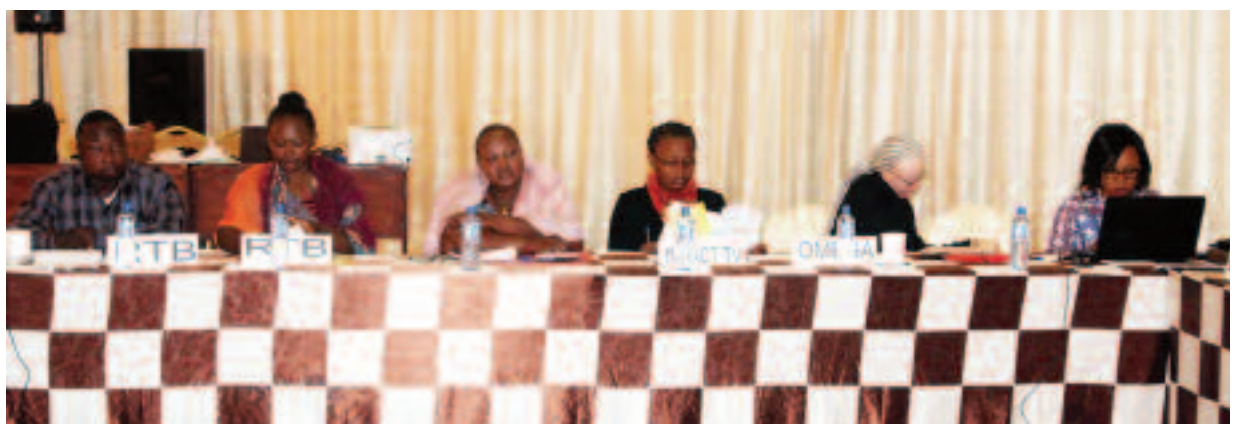
Les journalistes, à travers six exposés, ont pu renforcer leurs capacités sur les questions de protection sociale