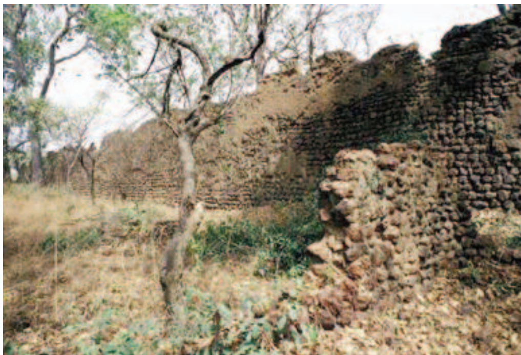
Ces constructions s'étendent sur une superficie de 11 130 m 2