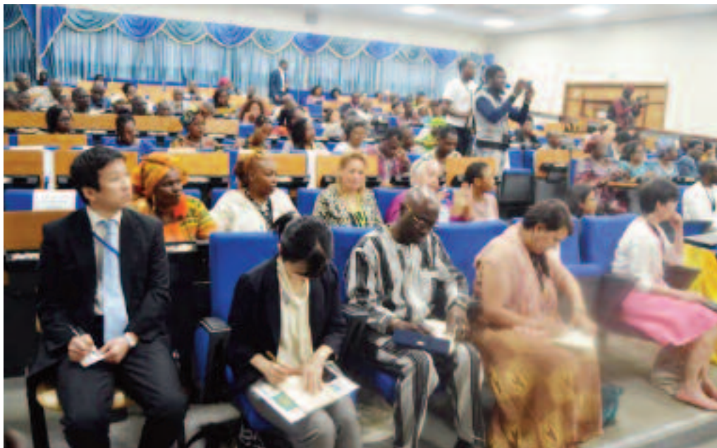
Cette rencontre a permis des échanges sans complaisance pour une équité des genres dans l'industrie cinématographique