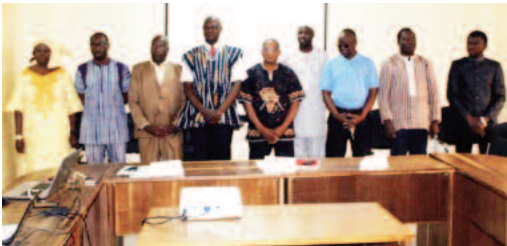
Les membres du conseil scientifique

du site au profit des générations actuelles et futures. A ce titre, ses membres veilleront à : concevoir des programmes de recherche visant à améliorer les connaissances sur les sites de la métallurgie ancienne du fer au Burkina Faso ; examiner et superviser des travaux de recherche, de conservation et de mise en valeur ; servir de contact avec le centre du patrimoine mondial de l'UNESCO pour tous grands travaux d'aménagement sur les sites ; informer et rendre compte au centre du patrimoine mondial de l'UNESCO de tous travaux de recherche, de conservation, de mise en valeur importants sur le site des ruines de Loropéni.