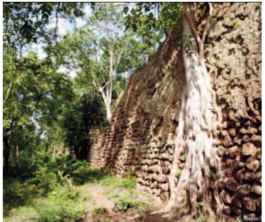
Malgré ces arbres les murailles tiennent encore debout

paoré, représentant le ministre de la Culture, des Arts et du Tourisme a déclaré que « ce site est une véritable richesse nationale et notre mission historique est de travailler à ce qu'il révèle tous ses secrets et à consolider son attractivité ». Les Ruines de Loropéni sont situées dans la commune de Loropéni (45 km de Gaoua dans la région du Sud-Ouest du Burkina Faso). Il s'agit de la forteresse la mieux préservée des dix que compte la région Lobi. Ce sont des murailles de blocs de pierre rouge non taillés et de moellons de latérite s'élevant jusqu'à six mètres de hauteur et sur une surface de 11 130 m 2 . Ces ruines s'inscrivent dans un ensemble plus large comptant une centaine d'enceintes de pierre.