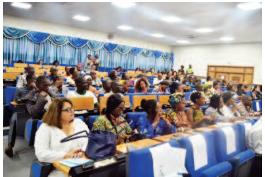
Les acteurs féminins du cinéma africain ont appelé à plus de solidarité entre elles