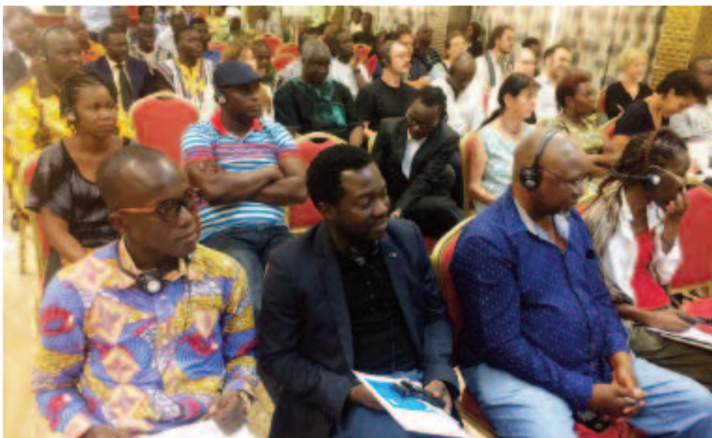
L'activité a regroupé une soixantaine de participants venus de quinze (15) pays d'Afrique et d'Europe

Des prestations musicales de l'artiste Khanzai sont intervenues entre les différentes allocutions. Au cours de la première phase de ce projet qui a été ouverte de juin à septembre 2018, quinze (15) projets de douze (12) pays africains ont été financés pour une enveloppe globale d'un million (1.000.000) d'euros.