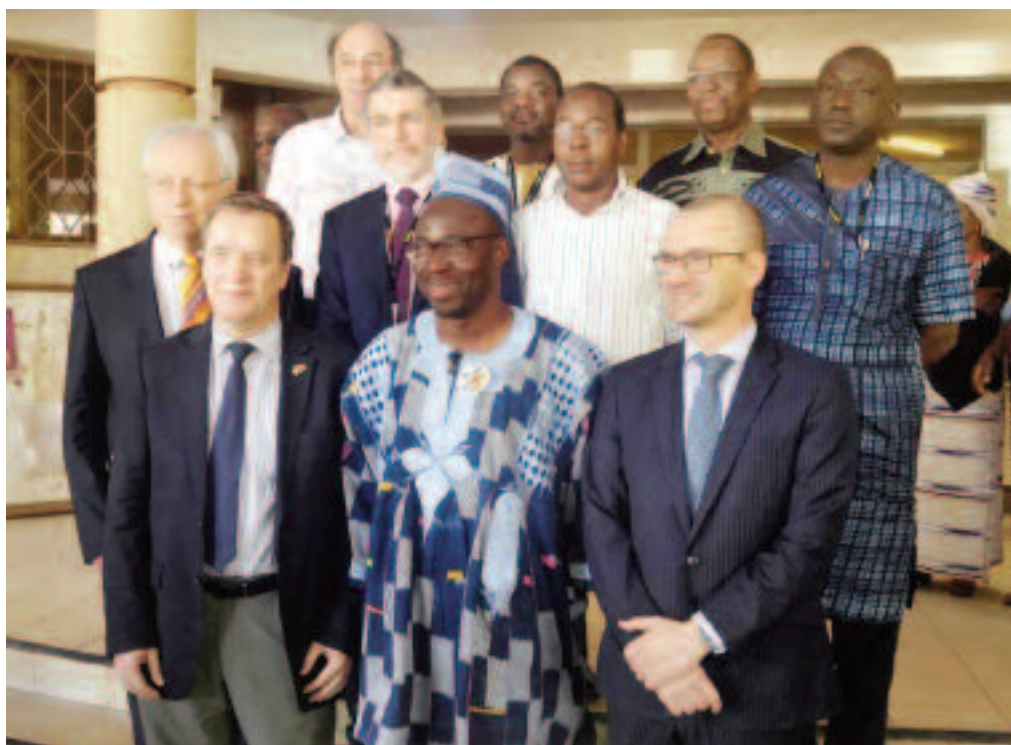
Photo de famille