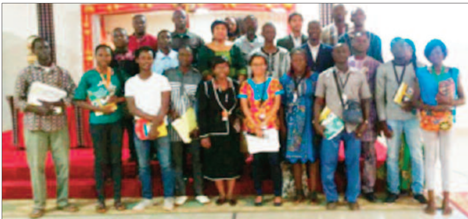
Les participants posant avec les organisateurs de la rencontre

Pour être sélectionné par le FIDC, le projet doit être évalué par la commission nationale comme répondant à une nécessité locale et émanant d'une organisation fiable. Toute la procédure de dépôt du dos-